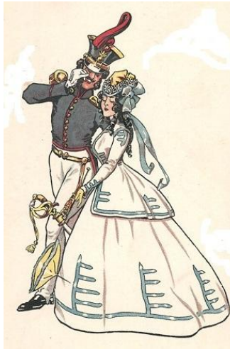
Artillerie Offizier in holder Begleitung um 1840

5. und 19. Mai 2018 im Schützenstand Horn